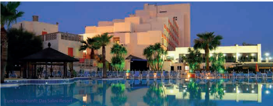
Eure Unterkunft: Das Salini Resort

„Es war ein schönes Erlebnis und ich habe dort meine Englischkenntnisse verbessert. Die Schule ist modern eingerichtet und die Lehrer sind wirklich nett und gut.“ – Raphael, 16 Jahre