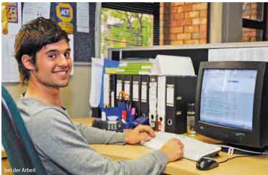
bei der Arbeit

Kein Unterricht: 16.12./25.12./26.12./27.12.2011/02.01./21.03./06.04./09.04./27.04./01.05./16.06./09.08./24.09./17.12./25.12/26.12.2012. Ausgefallener Unterricht wird nicht nachgeholt.